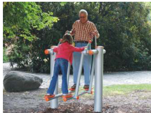
Demnächst Bereicherung in der AktivRegion: Mehrgenerationenbewegungsplatz

Mit den geplanten Mehrgenerationenbewegungsplätzen in Großenbrode und Burg soll der demographischen Entwicklung und dem gestiegenen Wunsch älterer Menschen nach adäquater Bewegungsmöglichkeiten Rechnung getragen werden. Da die Stadt Fehmarn voraussichtlich die Trägerschaft für beide Gemeinden übernimmt, kann eine Förderung von 55% der förderfähigen Nettokosten erreicht werden. Des Weiteren wird die Errichtung eines Lotsendienstes (u. a. unabhängige Sozialberatung, Etablierung räumlicher Treffpunkte für Senioren) angestrebt.