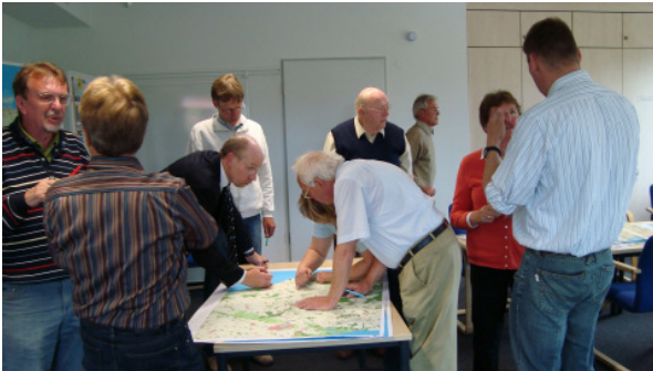
Projektgruppe Radwege macht sich ans Werk

Nächster Termin: Voraussichtlich Ende August