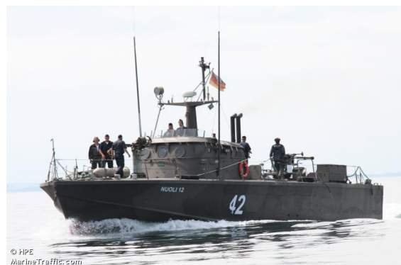
Schnellboot NUOLI 12 auf Schleichfahrt

Seit Sonntag, 12. Juli 2009 ist der Hafen der Stadt Neustadt um eine Attraktion reicher. Das ehemalige Schnellboot der finnischen Marine bietet künftig „open-ship“-Veranstaltungen und hat sich insbesondere die maritime Brauchtumpflege zum Ziel gesetzt. Darüber hinaus arbeitet der gemeinnützige Verein „NUOLI 12 e.V.“ mit diversen Jugendorganisationen zusammen. Insgesamt unterstützt die AktivRegion Wagrien-Fehmarn das Projekt mit Fördermitteln in Höhe von etwa 20.000 €.