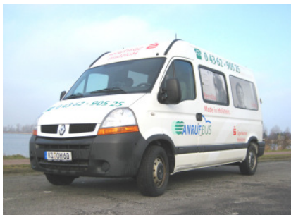
Im Kreisnorden unterwegs: Der AnrufBus

Das letzte Treffen fand am 22. Juli 2009 statt. Zentrales Thema war die Fortführung des Angebotes „AnrufBus“ im Nordkreis. Das Projekt wurde positiv bewertet und wird nun mehr zur Reife getragen, um es bei der nächsten Vorstandssitzung beschlussfähig vorstellen zu können. Damit erhofft die AktivRegion die Weiterentwicklung dieses benutzerfreundlichen Modells zur Förderung der ländlichen Mobilität.